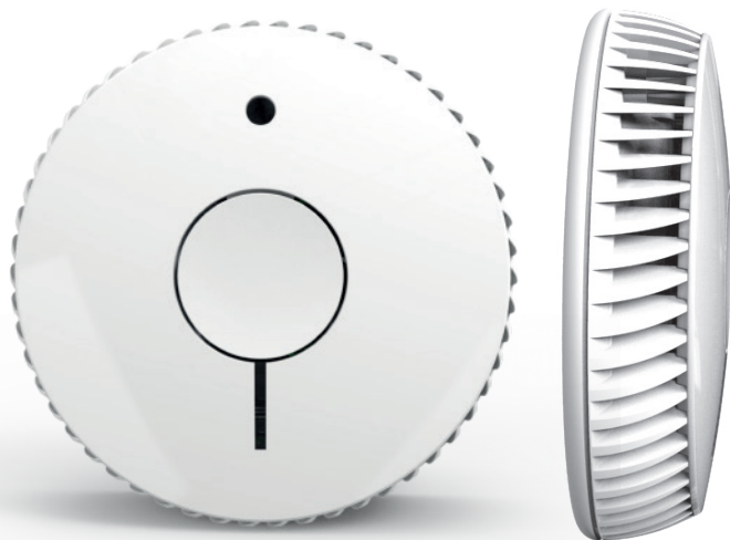
Visuels non contractuels, les marquages sur l'appareil peuvent varier selon le pays